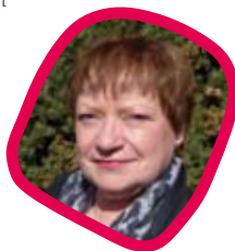
Carola Hauger Verwaltung